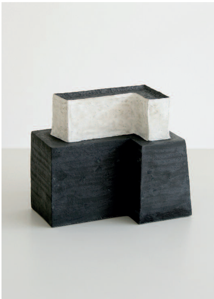
Impromptu 46 2015 L 24 cm Steinzeug